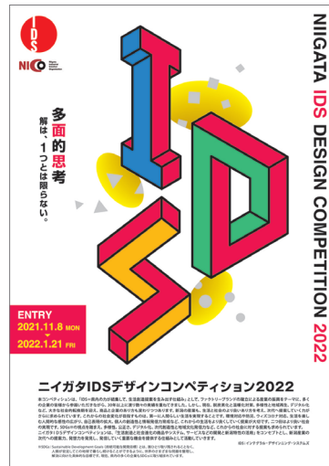
CL:公益財団法人にいがた産業創造機構 AD:山本敦 D:西山美智雄

この度、公益財団法人にいがた産業創造機構(NICO)様が主催される、「ニイガタIDSデザインコンペティション2022」のキービジュアルを採用していただきました。デザインのコンセプトは「多面的思考」。I、D、Sの文字を、さまざまな視点から見た立体を組み合わせた【だまし絵】で表現。キャッチコピー(解は、1つとは限らない)は、現在、社会問題となっている、温暖化対策、多様性と地域再生、そしてウィズコロナ対応などに対し、新しい社会が求めるものは何か、今見えている常識を疑い、新たな視点でアイデアを産み出す、といったイメージを込めました。毎年たくさんの魅力ある商品や仕組みが集まる当コンペですが、2022年も審査に向け、エントリーが開始されています。今回もどんな独創的な魅力を持った商品や仕組が集まるのか期待が高まります。(西)