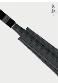
上/小林南穂 「小国和紙 ふくら」