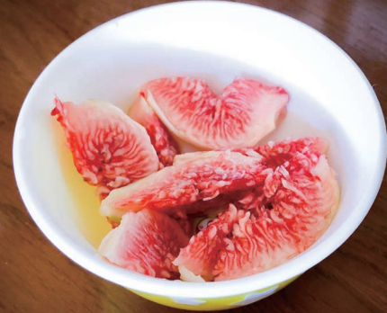
おうちで採れた無花果です！