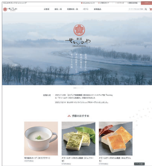
CL:株式会社丸魚 魚沼水産 AD:南雲和子 CD,D:丸山紗弓 PL:加藤雄吉郎

新潟県小千谷市から越後の郷土料理を届ける、せんのやオンラインショップ。そのECサイト企画構成、構築、商品撮影まで一式お手伝いさせていただきました。まずはじめに、具体的なペルソナ像を細かく設定し、そのターゲットに合わせて、サイトのトーン&マナーを展開。サイト全体は白を基調とし、シンプルで見やすく、「上品」「優しい」といったイメージで制作しました。のっぺや棒鱈煮をはじめ、オリジナル商品「蔵人漬」等、素材本来の美味しさを引き出した逸品が勢ぞろいしております。お歳暮シーズン。新潟で生まれた食を、お世話になったあの方へぜひお届けしてみたいかがでしょうか。(加)