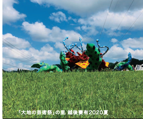
「大地の芸術祭」の里 越後妻有2020夏