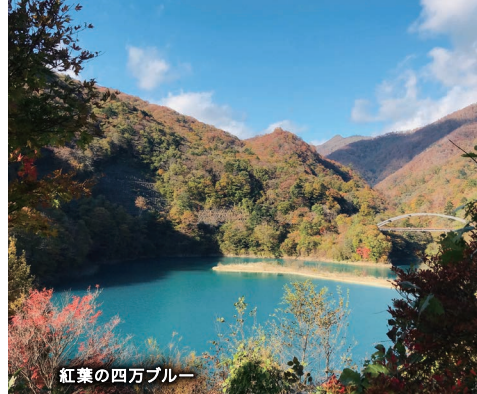
紅葉の四万ブルー