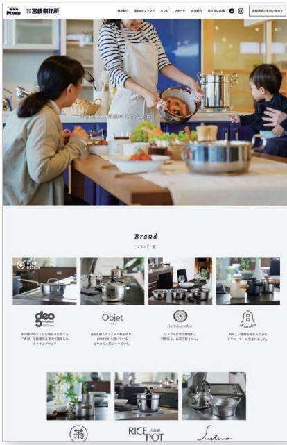
URL: https://miyazaki-ss.co.jp/ CL:株式会社宮崎製作所 PL:加藤 雄吉郎 WEBD:新澤 圭二

会話が弾むあたたかい食卓は、いつの時代も変わらない幸せの時間です。こんな時期だからこそ、宮崎製作所様の製品を通じて、家族の笑顔を育ててみてはいかがでしょうか。(加藤)