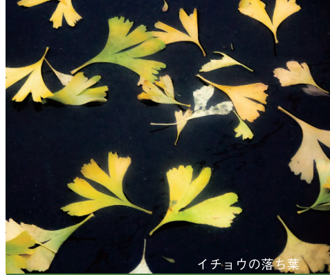
イチヨウの落ち葉