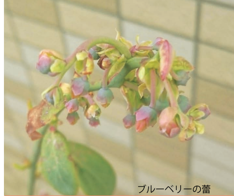
ブルーベリーの蕾