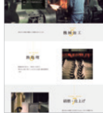
PL:ニツ家 聡司 D:新澤 圭二