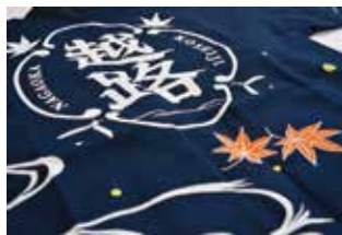
PL・村上敦子 AD・D・山本拓志、巻淵章郎