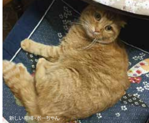
新しい相棒・ボーちゃん