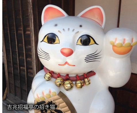
吉兆招福亭の招き猫