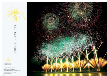
企画・発行：長岡花火デザインプロジェクト 印刷・製本：株式会社 中越 書・イラスト：平野壮弦 PL：村上 C：加藤 D：永井