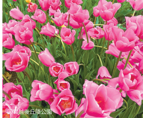
国吉越後丘陵公園