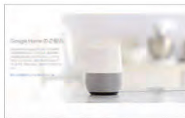
Google Home URL : https://madeby.google.com/home/ 運営会社 : Google

LINEの「WAVE」、Googleの「Google Home」、アマゾンジャパンの「Amazon Echo」など続々と発売される予定のようです。今のところの日本版製品の情報もあまり出てはみませんが、発売されたら試してみる価値はあるかもしれません。(宮)