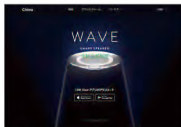
Clova URL : https://clova.ai/ja 運営会社 : NAVER・LINE