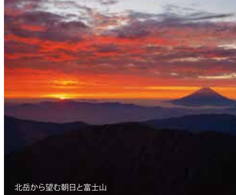
北岳から望む朝日と富士山