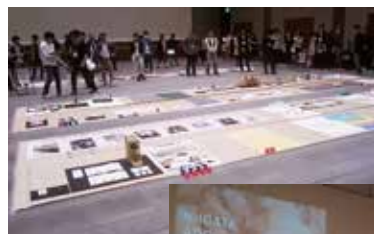
最終公開審査(上位10作品が決定)