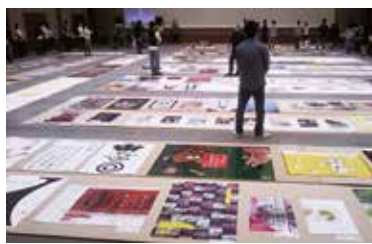
1次公開審査(入選作品が決まります)