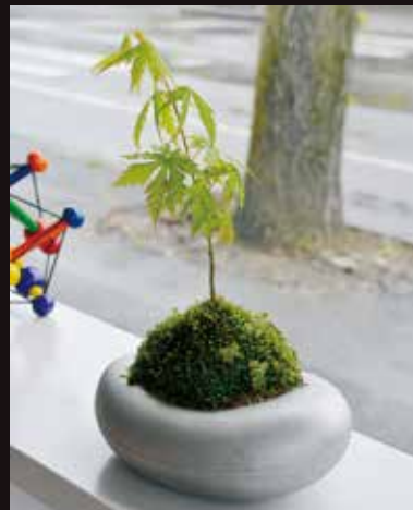
「ヤマモミジ」の苔玉

春の新緑がすがすがしい季節となりましたが、今回はアルミ花器「イケダマ」を使って苔玉作りに挑戦しました。若葉のまぶしい「ヤマモミジ」を山から採ってきて、苔を根元に巻いて、イケダマの上にアレンジ。イケダマは生け花用の商品ですが、自然の石がモチーフなので苔玉の風合いとよくマッチしてくれました。しばらくプラザ内に展示する予定です。