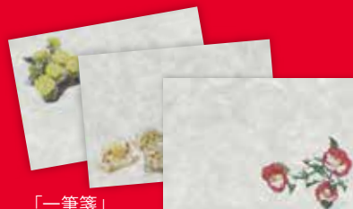
「一筆箋」 冬のイラスト3点セット1,000円(税抜) サイズ(一筆箋):140×92mm

わらぶでは、小国和紙の素朴な魅力を、手軽に感じて頂けるよう、「一筆箋」などの小物も製作しております。その中の「春夏秋冬」シリーズは、それぞれ季節に応じた3点のイラストが描かれた一筆箋3枚と封筒2枚が1セットになっています。例えば春は「つくし」、夏は「スイカ」、秋は「モミジ」、冬は「ツバキ」などがあり、どれも四季の風情を感じられる、あじわいのあるイラストです。近代美術館や、まちなか観光プラザなどで季節ごとにイラストを替えて販売させて頂いております。