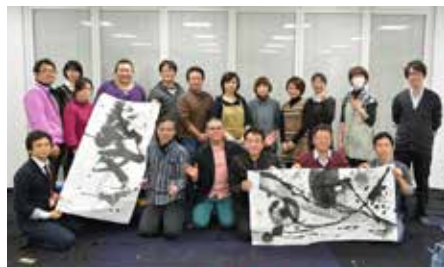
参加者全員での記念撮影。4人1組で完成させた合作は、パートナーズPLAZA内のホワイエにて、3月中旬まで展示しておりますので、是非ご覧ください。