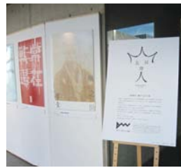
人気投票NO.1「上杉謙信」