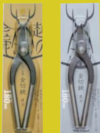
新パッケージデザイン 左:越の金鹿、右:OEM用 AD/D:山本敦

漢字はもともとひとつひとつに意味を持っています。象形文字から金文字、篆字(てんじ)と言われる変遷をへて現代の漢字が形づけられました。古来の文字はとても魅力的であり、生命感を感じます。金鹿工具製作所(三条市)は、量販向けの金鋏を製造しています。「越の金鹿」ブランドは、昔ながらのデザインの金鋏のシリーズ。その素朴なカタチは年月をかけて必然的に生まれたカタチです。今回、ロゴマークを新しくデザインした際のコンセプトは「伝統の切れ味」。新しさを出すのではなく、「伝統」という年月の偉大さをイメージしてデザインをしました。そのブランド独自の持つ世界観を表現することが、ブランディングに必要なことだと思います。