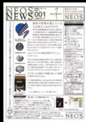
↑ NEOS NEWS創刊号 (2002/7)