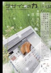
↑ 最初の大判のカラーDM (2007/7)