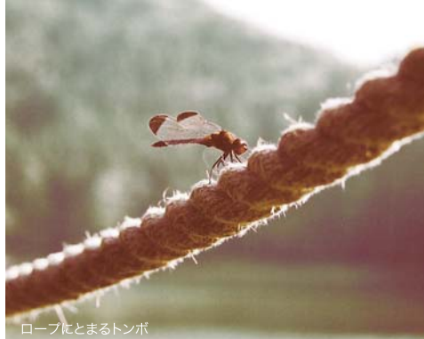
ロープにとまるトンボ