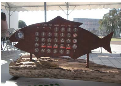
人気投票NO.1「時をつげる潮風」(D:三浦 正晶)