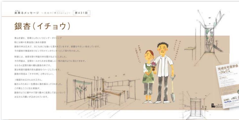
[チラシ]集舞いるメッセージ第431~434回