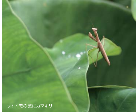
サトイモの葉にカマキリ