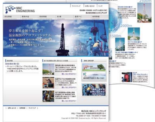
株式会社NNCエンジニアリング http://www.nnc-eng.jp

今回の会社合併により、WEBの他、ロゴマーク、会社案内等の各ツールも全面リニューアルした。