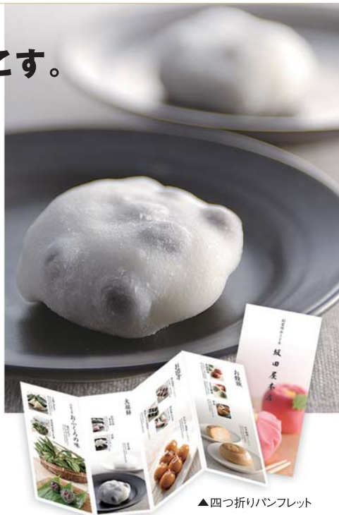
▲四つ折りパンフレット

今後ブランドづくりの核として活用し展開していく予定。「まず消費者に商品のクオリティをイメージしてもらう」商品購買の原点はやはりビジュアル、そしてストーリーです。(山谷)