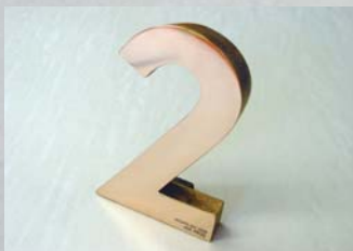
ADC賞のブロンズトロフィー