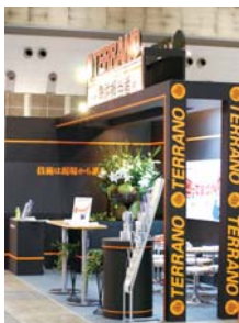
▲NAZEブース www.naze.biz ◀テラノ精工(株)ブース www.terrano-seiko.co.jp