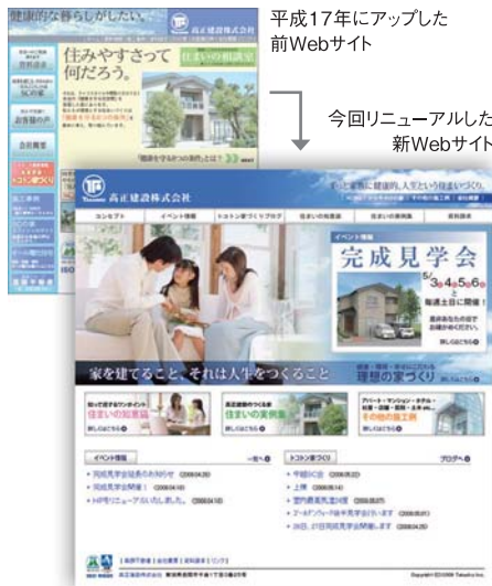
◆高正建設株式会社 http://www.takasho-k.co.jp

今回は、ブログを再編集してリニューアルした高正建設株式会社のWebサイトをご紹介します。リニューアルの目的は、まずお客様向けの知恵袋的な更新情報をコンテンツ化して閲覧しやすくしたこと。さらに、キャンペーンなどのイベント情報とブログを分けることで、わかりやすく情報を整理し、更新しやすくしました。3年前の構築の際、最初からページ数を増やさなかったのは生きた情報でWebサイトを育てるつもりだった訳で、まさにやっとスタート地点に到達した感じ。いつまでも古びない、フットワークの軽さと会社独自のコンテンツが今集客するサイトの必須条件です。(山谷)