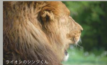
ライオンのシンジくん