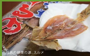
社員の健康の源、スルメ

今年は、視力の低下を抑えるためにブルーベリーのサプリも飲もうかと。健康体で、今年も頑張ります!(今井)