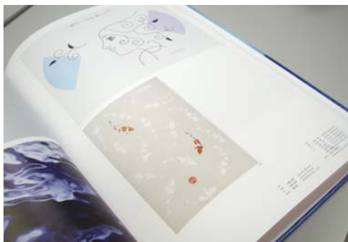
ADC年鑑2007(右) 掲載されたページ(左) ポスター部門ページのしんがりに 掲載。おおとりを飾ったと自分では 勝手に解釈しております。

東京アートディレクターズクラブ(以下ADC)と言っても、一般の人にはなじみはないと思いますが、実はグラフィックデザイン業界の中では「あこがれ」的存在です。グラフィックデザインの頂点を極めたわずか84名のデザイナーで構成された組織で、あえて人数を増やさず会員になることは極めて難しい団体です。そのADC会員たちが日本のグラフィックデザインを審査して、毎年刊行しているのが「ADC年鑑」と呼ばれるものです。まさに、この年鑑に掲載されることがグラフィックデザイナーの夢であり目標と言ってもいいと思います。そして「やまこし道楽カフェ」ポスターが昨年2月の新潟ADCの準グランプリ受賞に続き、ポスター部門で入選!! ポスターの応募総数3,382点のうち、掲載されたのは274点。3,000点以上が選出されなかったわけです。これからももっと上を目指して頑張りますので、ご期待ください。(山本)