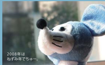
2008年は ねずみ年でちゅー。

今年も残り1ヶ月、悩ましくも楽しくもある、年賀状デザインの季節が来ました。職業柄、秋に冬のものデザインしたり、冬に春のものデザインしたりと季節を前倒しにすることが多いので「今何月だっけ?」って思うこともしばしばです。年賀状は、新年の清々しい気持ちになることが大切ですが、これがなかなか慌ただしい師走には難しかったです…。お世話になった方への新年のご挨拶、自分らしいデザインの年賀状をお送りしたいですね。(南雲)