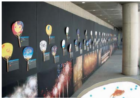
うちわ展会場(上)と一番投票の多かったうちわデザイン(右)

また10/6~14まで、近代美術館で亀倉雄策展とJAGDA新人賞展が開催され、デザインの今を体験させてくれる貴重な展示会だった。