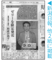
新潟日報、他2紙に掲載

三条市の洋菓子製造販売の老舗ヤマトヤが地域の天然水「千年悠水」を使ったゼリーを開発した。Webサイト開発をお手伝いしてから6年目、今回は商品コンセプトをシンプルに打ち出した自信作で、雑みのないおいしい水で定評がある旧下田村の天然水を活かしたオリジナル商品として地元三条市も推奨している。プロモーションはチラシ、ポスター、Web、地元紙などパブリシティも効果的に展開、従来の顧客から特に若い層も意識しより広い年齢層にアピール。地元の強みを活かした商品開発と販売促進が、新しい地域ブランドを創る好例だ。(山谷)