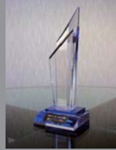
準グランプリのトロフィー