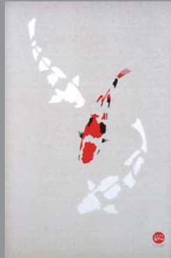
グランプリは、きりんざん「もみじ」パッケージ。 (AD:石川竜太)