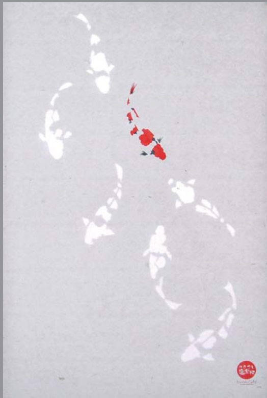
やまこし道楽村 DOURAKU CAFE 店内ポスター 4点シリーズの3点

第三回ブランディングセミナーを4月20日に開催! 「人気インテリアショップ経営者に学ぶ、ブランドづくりの極意」講師…SHS城丸社長